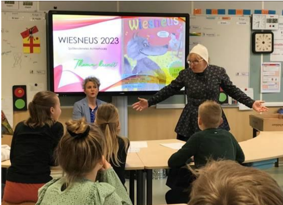
Fuchs en Vos waren bij de 1e Wiesneus-les van dit jaar en zijn ook van partij op het Kinder Kunstcircuit